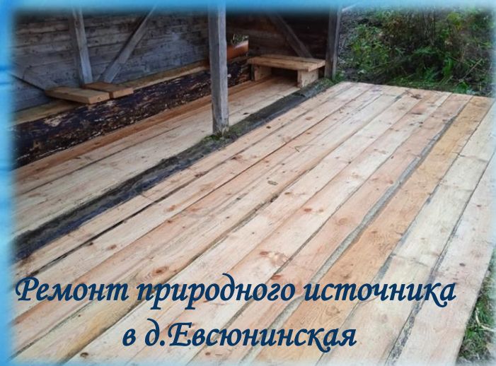
Ремонт природного источника в д.Евсюнинская