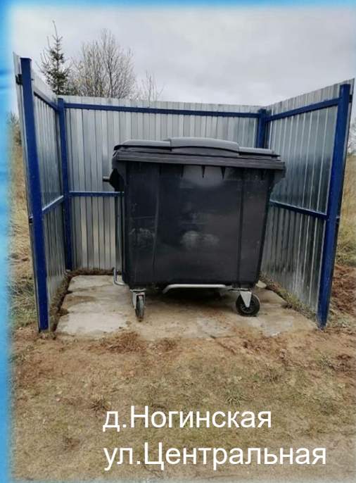
д. Ногинская ул. Центральная