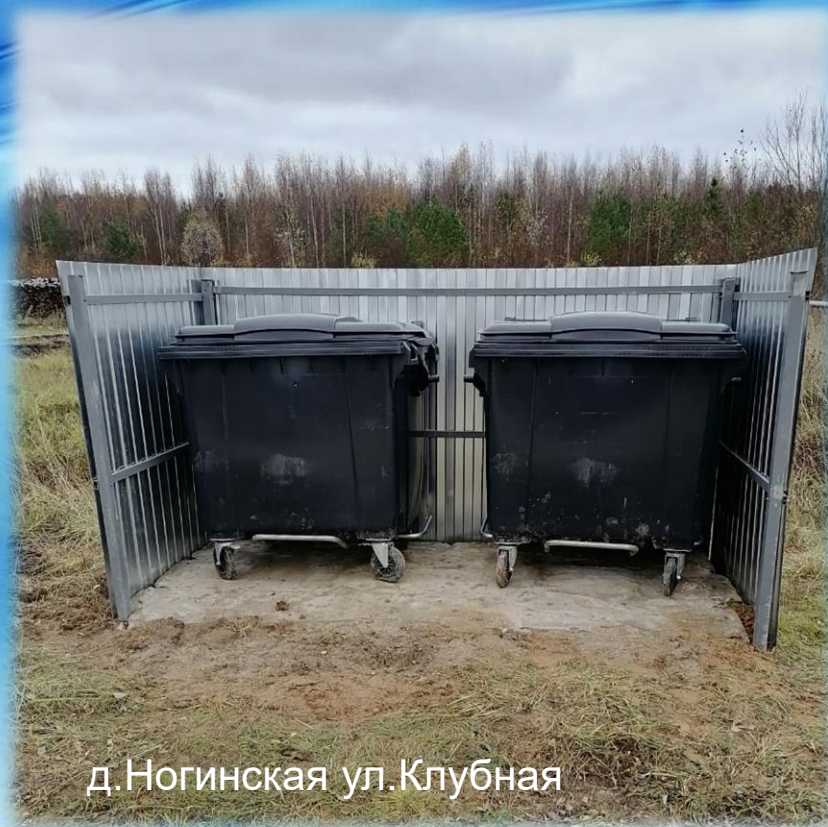
д. Ногинская ул. Клубная