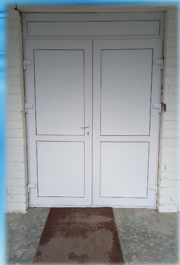
Ремонт входной группы в Морозовском ФОКе