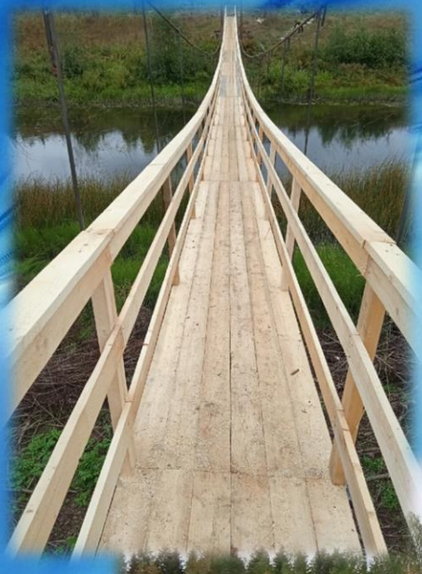
Сооружение подвесного моста через реку в п.Пежма