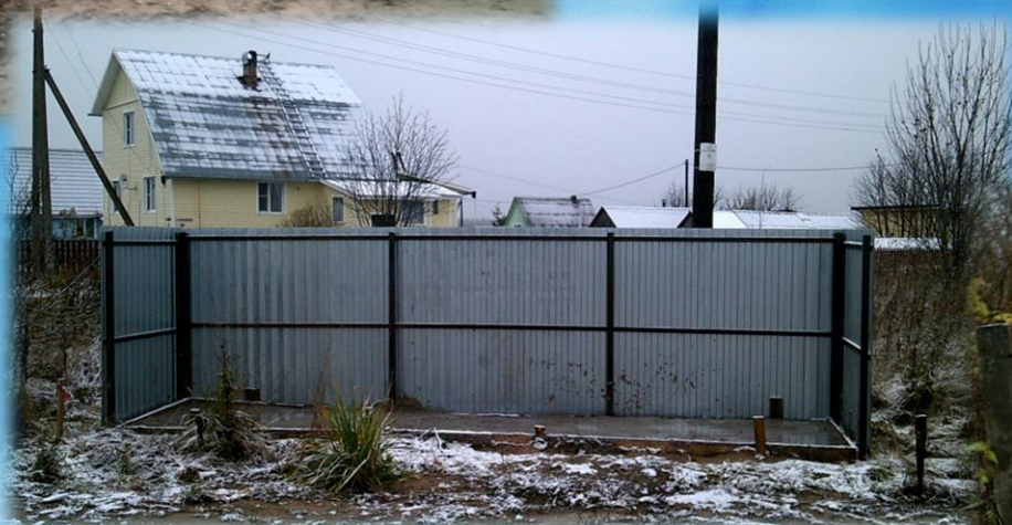
Обустройство контейнерных площадок для накопления ТКО