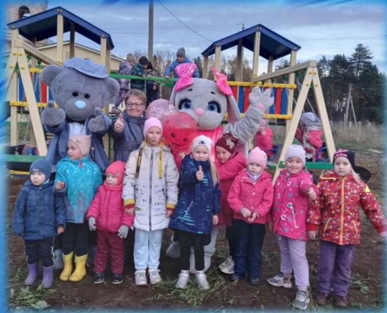
Обустройство детской площадки в д.Сметанино