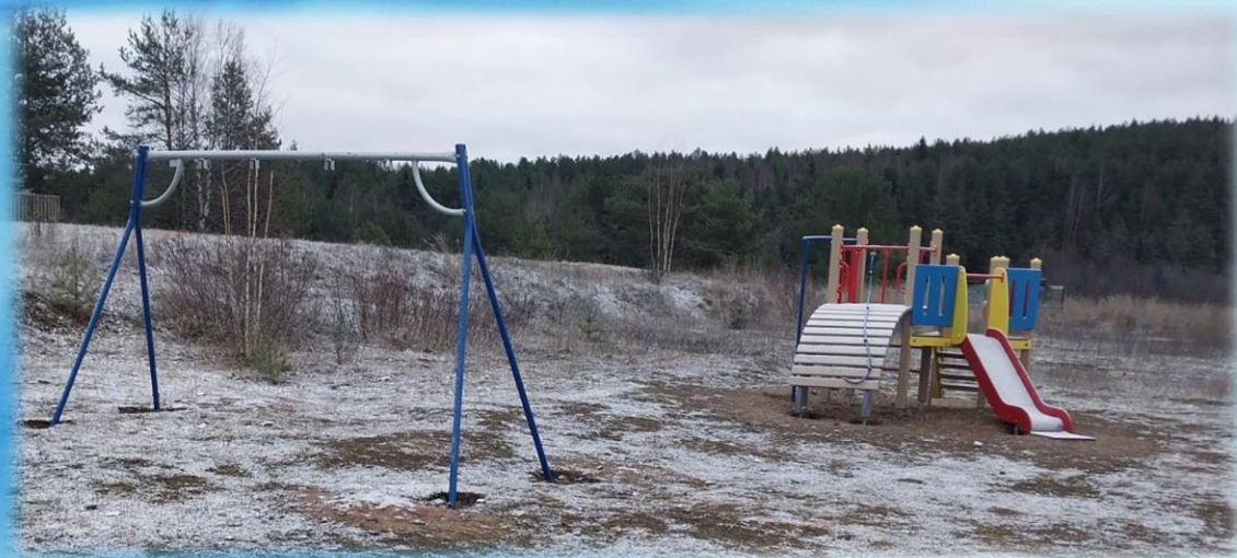
Обустройство детской площадки в д. Леушинская