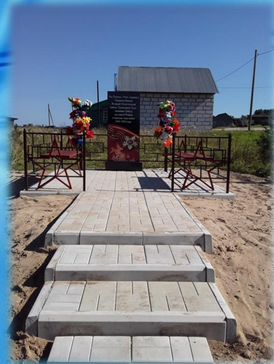
Строительство памятника в п. Каменка