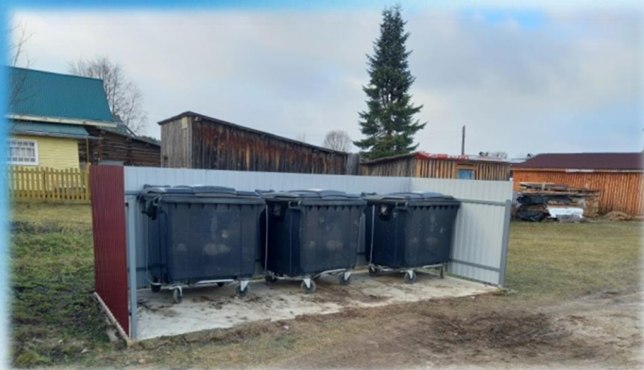
Обустройство контейнерных площадок для накопления ЛТКО