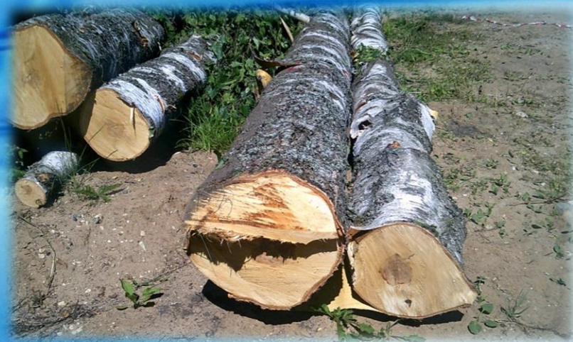
Спиливание аварийных деревьев